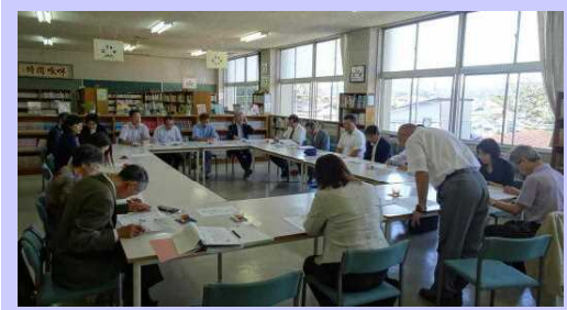
合同学校評議員会 会場校校長の挨拶

9月6日に行われた「民生委員との情報交換会」をはじめ、毎週のように地域の方々が来校し、学校、生徒、教職員の様子を参観してくださっています。先日は他校の学校評議員会の方々から「一中生の授業中の表情が明るく、にこやか」「校内がきれいだ」「挨拶もすばらしい」「祭りの練習に参加する生徒の様子から地域への思いを感じた」などの感想をいただきました。